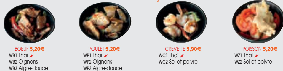
BOEUF 5,20€ WB1 Thai WB2 Oignons WB3 Aigre-douce POULET 5,20€ WP1 Thai WP2 Oignons WP3 Aigre-douce CREVETTE 5,90€ WC1 Thai WC2 Sel et poivre POISSON 5,20€ WZ1 Thai WZ2 Sel et poivre