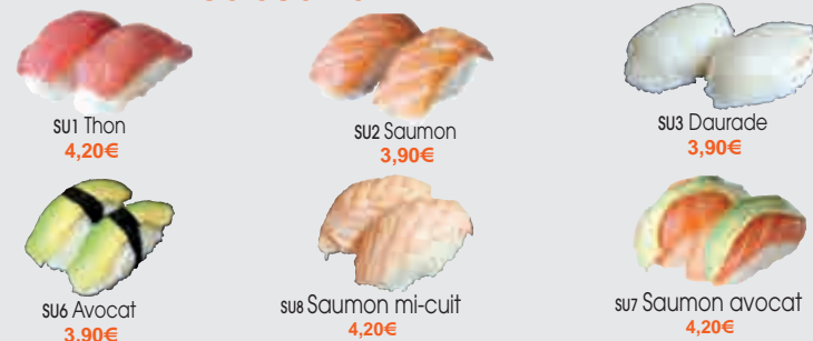
SU1 Thon 4,20€ SU2 Saumon 3,90€ SU3 Daurade 3,90€ SU4 Crevette 3,90€ SU6 Avocat 3,90€ SU8 Saumon mi-cuit 4,20€ SU7 Saumon avocat 4,20€