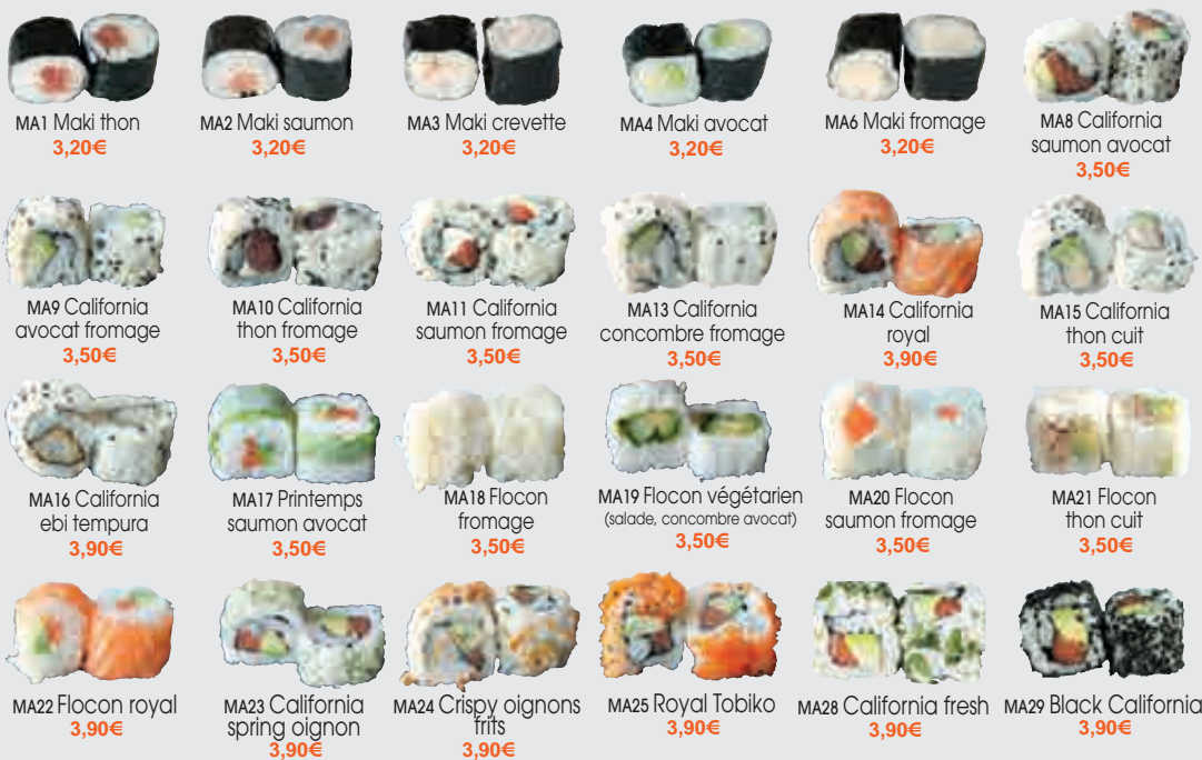
MA1 Maki thon 3,20€ MA2 Maki saumon 3,20€ MA3 Maki crevette 3,20€ MA4 Maki avocat 3,20€ MA6 Maki fromage 3,20€ MA8 California saumon avocat 3,50€ MA9 California avocat fromage 3,50€ MA10 California thon fromage 3,50€ MA11 California saumon fromage 3,50€ MA13 California concombre fromage 3,50€ MA14 California royal 3,90€ MA15 California thon cuit 3,50€ MA16 California ebi tempura 3,90€ MA17 Printemps saumon avocat 3,50€ MA18 Flocon fromage 3,50€ MA19 Flocon végétarien (salade, concombre avocat) 3,50€ MA20 Flocon saumon fromage 3,50€ MA21 Flocon thon cuit 3,50€ MA22 Flocon royal 3,90€ MA23 California spring oignon 3,90€ MA24 Crispy oignons frits 3,90€ MA25 Royal Tobiko 3,90€ MA28 California fresh 3,90€ MA29 Black California 3,90€ MA30 White California 3,90€ MA31 Nutella mangue 3,90€ MA27 Maki nutella 3,50€