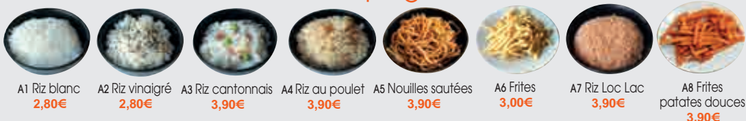
A1 Riz blanc 2,80€ A2 Riz vinaigré 2,80€ A3 Riz cantonnais 3,90€ A4 Riz au poulet 3,90€ A5 Nouilles sautées 3,90€ A6 Frites 3,00€ A7 Riz Loc Lac 3,90€ A8 Frites patates douces 3,90€