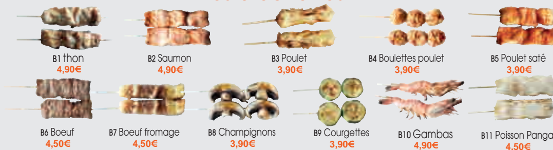
B1 thon 4,90€ B2 Saumon 4,90€ B3 Poulet 3,90€ B4 Boulettes poulet 3,90€ B5 Poulet saté 3,90€ B6 Boeuf 4,50€ B7 Boeuf fromage 4,50€ B8 Champignons 3,90€ B9 Courgettes 3,90€ B10 Gambas 4,90€ B11 Poisson Panga 4,50€