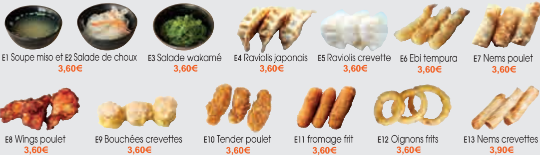
E1 Soupe miso et E2 Salade de chou 3,60€ E3 Salade wakamé 3,60€ E4 Raviolis japonais 3,60€ E5 Raviolis crevette 3,60€ E6 Ebi tempura 3,60€ E7 Nems poulet 3,60€ E8 Wings poulet 3,60€ E9 Bouchées crevettes 3,60€ E10 Tender poulet 3,60€ E11 fromage frit 3,60€ E12 Oignons frits 3,60€ E13 Nems crevettes 3,90€