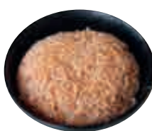
A7 Riz loc lac