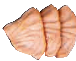
SA4 Saumon mi-cuit