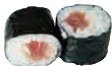
MA1 Maki thon