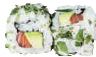
MA28 California fresh x4