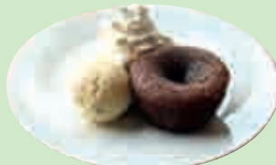
Fondant au chocolat 4,50