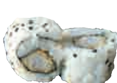
MA16 California ebi tempura