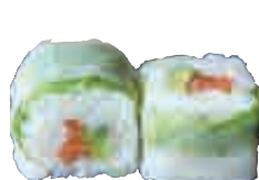
MA17 Printemps saumon avocat