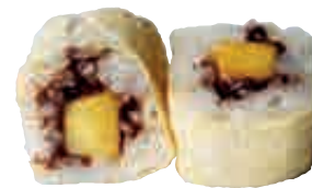
MA31 Maki Nutella mangue x4