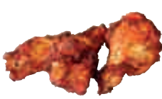
E8 Wings poulet