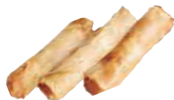
E13 Nems crevettes x3