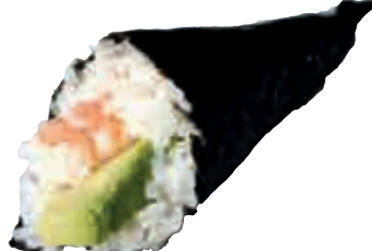
TM3 Crevette avocat