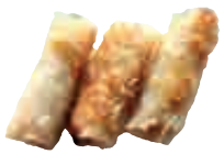
E7 Nems poulet