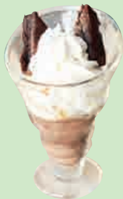
New York Brownies 4,50

2 boules cookie-dough, cookie au chocolat, sauce chocolat, crème fouettée