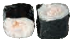
MA3 Maki crevette