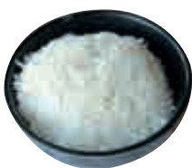
A1 Riz blanc