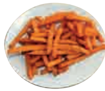
A8 Frites patate douce