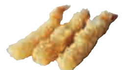
E6 Ebi tempura