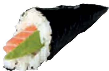
TM1 Saumon avocat