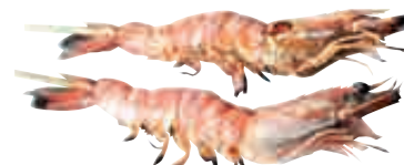
B10 Brochettes gambas x2