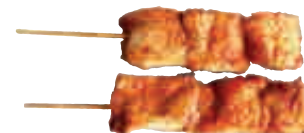
B5 Poulet saté