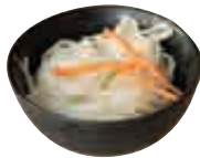
E2 Salade de choux