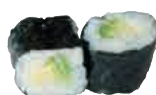
MA4 Maki avocat