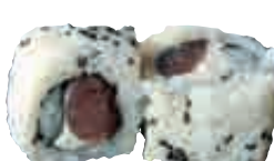
MA10 California thon fromage