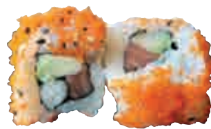
MA25 Royal Tobiko x4