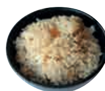
A4 Riz au poulet