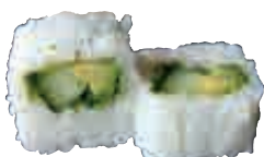
MA19 Flocon végétarien (salade, concombre avocat)