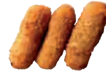
E11 fromage frit