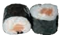
MA2 Maki saumon