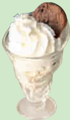
Cookie Crazy 4,50

2 boules cookie-dough, cookie au chocolat, sauce chocolat, crème fouettée