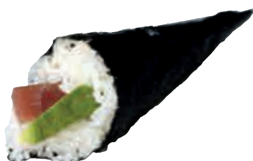
TM2 Thon avocat