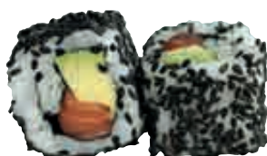
MA29 Black California x4