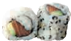
MA8 California saumon avocat