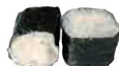
MA6 Maki fromage