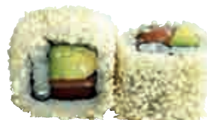
MA30 White California x4