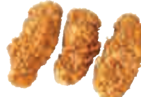
E10 Tenders poulet