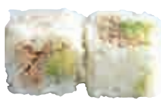
MA21 Flocon thon cuit