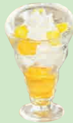
Hiro Mango 4,50

2 boules vanille-pécan, 2 gâteaux Oreo, sauce caramel, crème fouettée