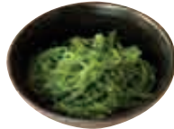
E3 Salade wakamé