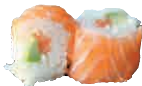
MA22 Flocon royal x4