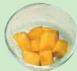
Coupe de Mangue 2,90