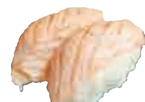
SU8 Sushi saumon mi-cuit