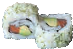
MA23 California spring oignon x4