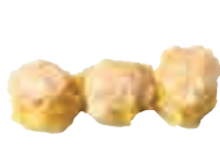
E9 Bouchées crevettes