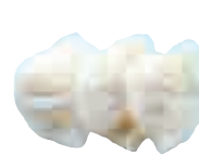
E5 Raviolis crevettes