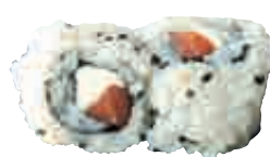
MA11 California saumon fromage