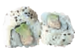
MA15 California thon cuit