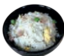
A3 Riz cantonnais