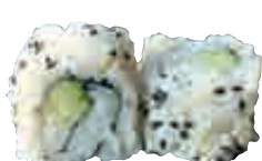
MA9 California avocat fromage