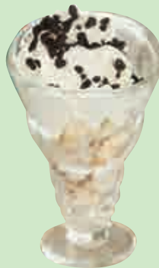
Oreo Pécan Addict 4,50

2 boules chocolat-brownie, morceaux de brownies, sauce chocolat, crème fouettée