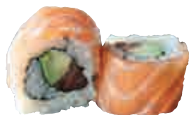
MA14 California royal