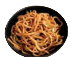
A5 Nouilles sautées aux légumes