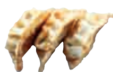
E4 Raviolis japonais