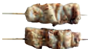
B1 Brochettes thon x2