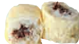
MA27 Maki Nutella