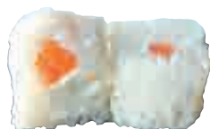
MA20 Flocon saumon fromage