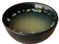
E1 Soupe miso