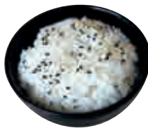
A2 Riz vinaigré