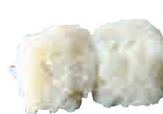
MA18 Flocon fromage