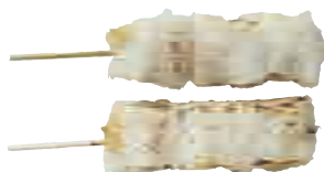
B11 Brochettes poisson Panga x2