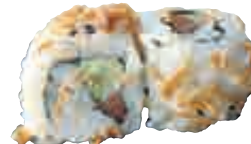
MA24 Crispy oignons frits