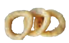
E12 Oignons frits