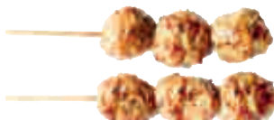
B4 Boulettes poulet