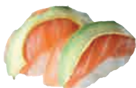
SU7 Sushi saumon avocat x2