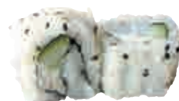
MA13 California concombre fromage